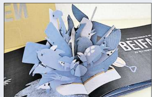
DAS PREISGEKRÖNTE AUFFALTBUCH DES LEBENSMITTELUNTERNEHMENS FOLLOWFISH